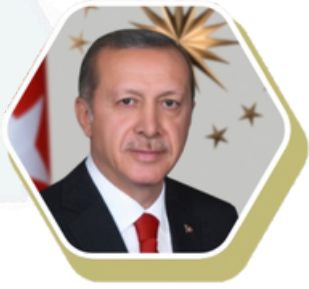
Ekselansları Sayın Recep Tayyip Erdoğan Türkiye Cumhurbaşkanı

Umman Sultanlığı'nın 2040 Vizyonu, ülkenin ekonomik çeşitliliğini artırmayı, sürdürülebilir kalkınmayı sağlamayı ve özel sektörle uluslararası iş birliğini güçlendirmeyi amaçlayan iddialı bir stratejik plandır.