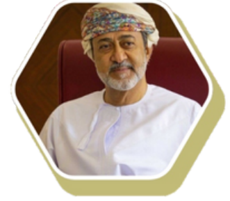
Sultan Haitham bin Tarık Al-Mu'azzam Umman Sultanlığı Sultanı ve Başbakanı

Türkiye Cumhurbaşkanı Ekselansları Recep Tayyip Erdoğan, Cumhurbaşkanlığı Külliyesi'nde gerçekleştirilen baş başa ve heyetler arası görüşmenin ardından Umman Sultanı Heysem bin Tarık ile düzenlenen ortak basın toplantısında "İlişkilerimize kurumsal bir çerçeve kazandırmak arzusundayız. Bu amaçla, Yüksek Düzeyli Stratejik İş Birliği Mekanizması dâhil, istifade edebileceğimiz çeşitli seçenekleri ele aldık. Dış ilişkiler, ekonomi, sanayi, yatırım, sağlık, kültür, tarım ve hayvancılık gibi alanlarda iş birliğimizi ilerletmeye yönelik 10 belge imzalandı. Ortak bildiri kabul edildi. Ekonomi ve ticari ilişkilerimizi, mevcut potansiyelimizi yansıtabilecek şekilde ilk aşamada 5 milyar dolara çıkarmayı hedefliyoruz. Müteahhitlik firmalarımız, Umman'da bugüne kadar 7 milyar dolar değerinde projeyi başarıyla tamamladı. Aziz kardeşimle, şirketlerimizin Umman 2040 Vizyonu'na yapabilecekleri katkılara da değindik. Bu vesileyle, Umman heyetinin yarın Türk iş dünyasının temsilcileriyle yapacağı toplantıdan somut neticeler alınmasını temenni ediyorum. BOTAŞ ile Ummanlı muhatabı arasında imzalanan anlaşma uyarınca, 2025 yılından itibaren Umman'dan sıvılaştırılmış doğalgaz tedarikine başlanacak olmasıyla, enerji alanındaki iş birliğimizde yeni bir döneme girmiş olacağız." diye konuşmuştur.